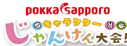
※2022のコーナータイトル冠例