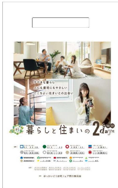
※配布予定のビニールバッグイメージ