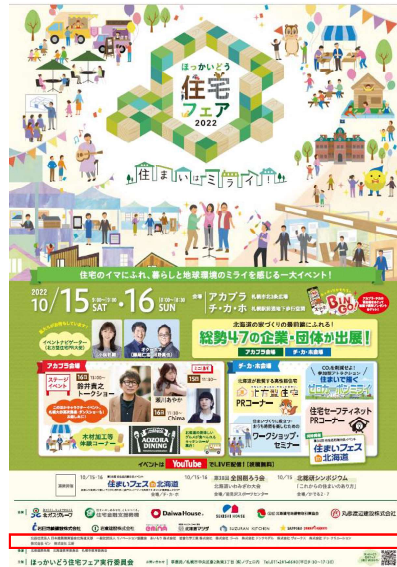
※ポスターご芳名掲載2022実施例