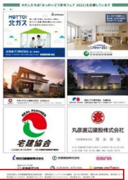
※公式パンフレット広告掲載2022実施例