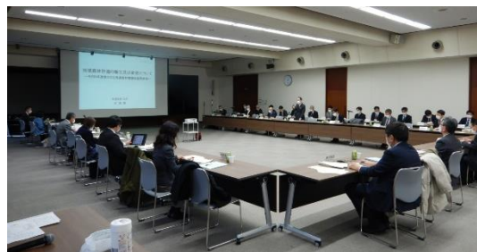
令和4年12月19日 森林審議会 (対面開催)