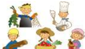
地域ぐるみで魅力発信