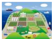
むらわが農山漁村

むらわが農山漁村を知ってもらい、好きになってもらうため、地域ぐるみでファンづくり！