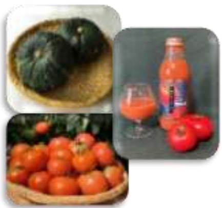
野菜、トマトジュース (当別町)