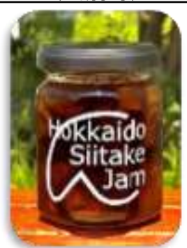
しいたけジャム(江別市)