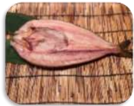
冷風熟成干し開ホッケ特大 (札幌市)

いしかりフェアでは、都市近郊で採れた鮮度の高い農産物や、石狩管内の食関連企業が製造した加工品・飲料を販売するほか、振興局や市町村による観光PRを行います。