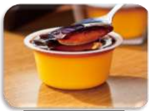
かぼちゃプリン (恵庭市)