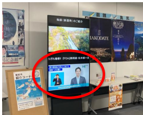
丘珠空港ビル内サイネージ