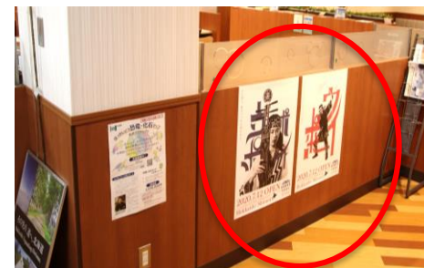
セイコーマート店内ポスター掲示

セブン-イレブン、ファミリーマート、セコマ、アリオ札幌、北洋銀行、北海道銀行、佐川急便、SMBCなど