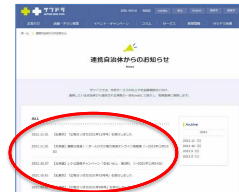
サツドラホームページ