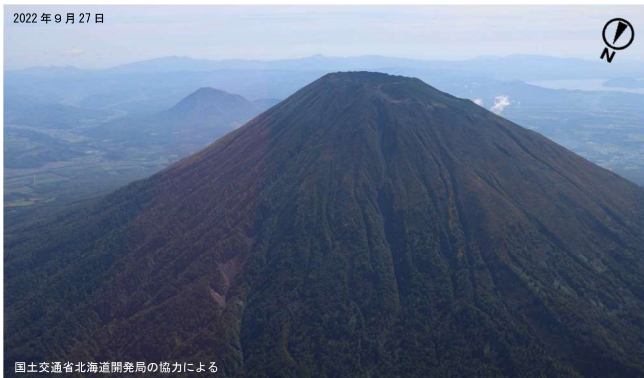
図2 羊蹄山 山体全体の状況 北西側上空（図1の①）から撮影