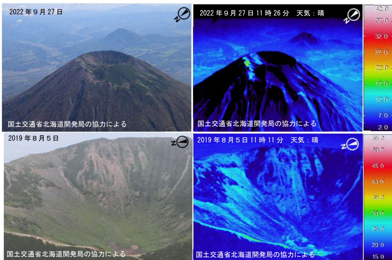
図3 羊蹄山 赤外熱映像装置による山頂火口の地表面温度分布