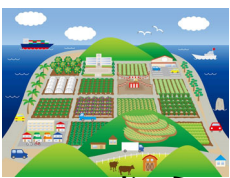
むらわが農山漁村

むらわが農山漁村を知ってもらい、好きになってもらうため、地域ぐるみでファンづくり！