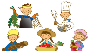
地域ぐるみで魅力発信