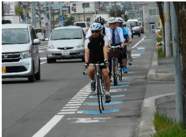
H29試験施工箇所について実走による検証