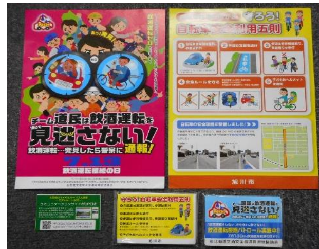
H30：チラシ配布による啓蒙活動