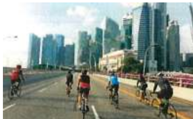
カーフリーサンデー2018（シンガポール）