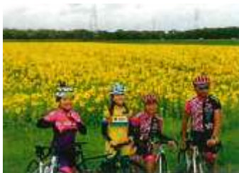
メディア・インフルエンサー招聘