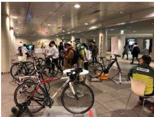
もっと自転車北海道inチカホ