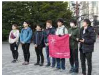
サイクルセーフティキャンペーン開始式（R1） 北大サイクリングクラブ安全利用宣言・模範走行