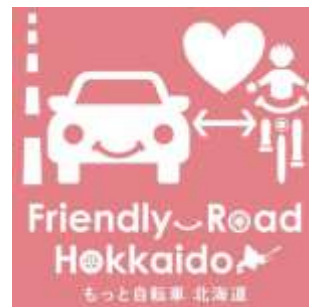
「フレンドリーロード北海道」ステッカー