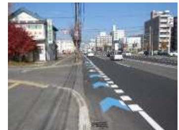
自転車ネットワーク計画に 基づく整備（旭川市）