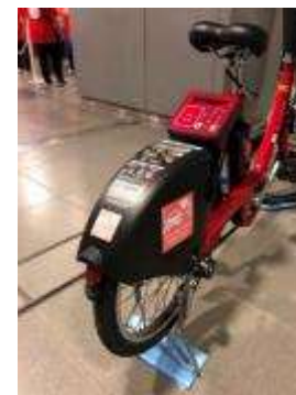
ポロクルと連携した普及啓発