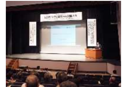
損害賠償保険の必要性や 加入促進に向けた講演