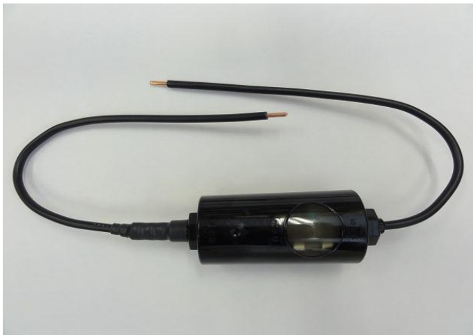
2線式自動点滅器外観

電子式自動点滅器として特許取得されており、先進的な技術が使われていることや、今後普及が進むことで全国展開の可能性も広がり、将来性の高い製品を期待できることが評価された。