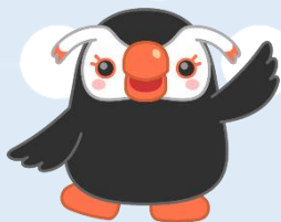
北方領土のイメージキャラクター えとぴりかの「エリカちゃん」