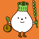
ウポポイ PRキャラクター トウレットポん