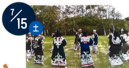
白老民族芸能保存会

アイヌ古式舞踊を体感！ 各地域のアイヌ古式舞踊を鑑賞した後は一緒に踊って楽しもう