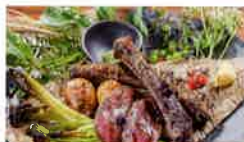
焚火ダイニング・カフェハルランナ