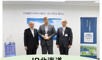
JR北海道 フレッシュキヨスク(株) 「北海道大雪山の天然水」