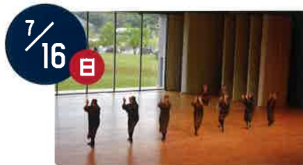
帯広カムイトウウポポ保存会