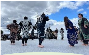
一般社団法人札幌大学 ウレシパクラブ