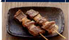
ピンナピンナキッチン 炎