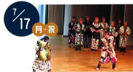
千歳アイヌ文化伝承保存会