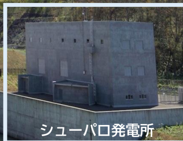
スーパーダム発電所