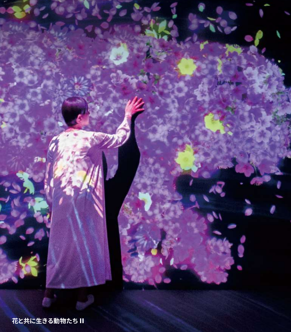
花と共に生きる動物たち II

札幌芸術の森美術館にて、「チームラボ 学ぶ!未来の遊園地と、花と共に生きる動物たち」を、2023.7.8(土)-9.3(日)に開催します。 チームラボの作品《花と共に生きる動物たちII》のほか、「共創」をコンセプトにした教育的なプロジェクトであり、他者と共に世界を自由に創造することを楽しむ「学ぶ!未来の遊園地」から、《世界とつながったお絵かき水族館》、《光のボールでオーケストラ》などを展示します。