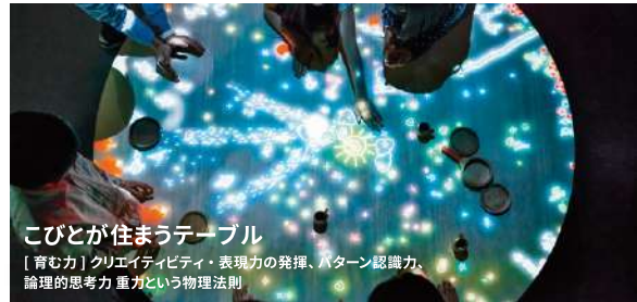
こびとが住まうテーブル [育む力] クリエイティビティ・表現力の発揮、パターン認識力、論理的思考力 重力という物理法則