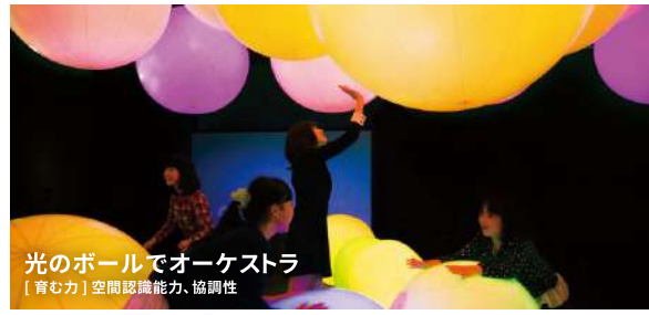
光のボールでオーケストラ [育む力] 空間認識能力、協調性