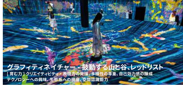
グラフィティネイチャー - 鼓動する山と谷、レッドリスト [育む力] クリエイティビティ・表現力の発揮、多様性の尊重、自己効力感の醸成 テクノロジーへの興味、生態系への視座、空間認識能力

[主催] 札幌芸術の森美術館(札幌市芸術文化財団)、STV札幌テレビ放送、チームラボキッズ [協力] kitpas [後援] 北海道、札幌市、札幌市教育委員会