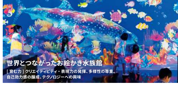
世界とつながったお絵かき水族館 [育む力] クリエイティビティ・表現力の発揮、多様性の尊重、自己効力感の醸成、テクノロジーへの興味