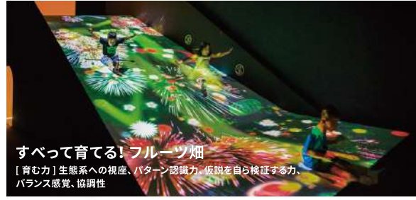
すべて育てる! フルーツ畑 [育む力] 生態系への視座、パターン認識力、仮説を自ら検証する力、バランス感覚、協調性