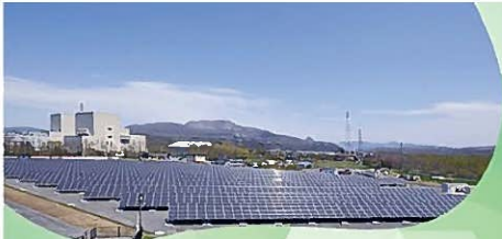
伊達ソーラー発電所（北海道電力）