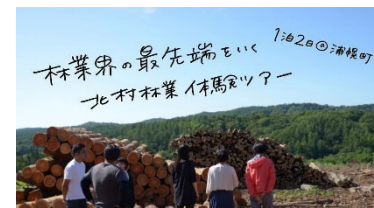
【体験ツアーの広報】