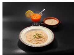
【地域野菜を使った商品】 (白花豆・人参・馬鈴薯)