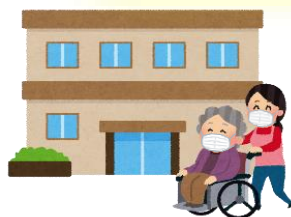
高齢者施設など に行くとき