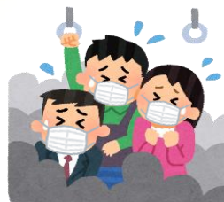
混雑した乗り物の中