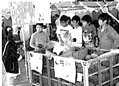
道の駅で 収穫したかぼちゃを販売