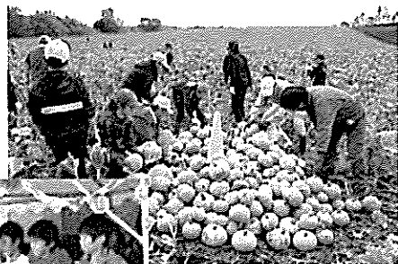
たくさんの かぼちゃを収穫♪

町内の小学校6年生の「総合的な学習の時間」において、有機圃場における「かぼちゃ栽培体験」授業を行っています。授業では、播種から収穫までの圃場実習のほか、収穫したかぼちゃを道の駅で開催される「輝農祭」でこどもたちが販売し、栽培から消費までの一連の流れを経験します。こどもたちが作ったかぼちゃは、町内外のたくさんの方々に食されており、売上金は被災地の復興支援に充てています。