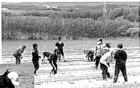
有機農業って何?を体験

有機農業の「ツライ!」「スゴい!」を伝え、地元農産物のファンに! 有機農業ならではの苦労や、なぜ自分たちにとって安全安心で環境にもやさしいのかを、実際に体験することで理解してもらい、将来、こどもたちが町を離れても、店頭で大空町の農産物が売られていたら、選んでもらえるように地元農産物を好きになってもらいたいと、活動を始めました。また、町内小中学校における学校給食用食材として、年6回、有機栽培のアスパラガスやかぼちゃなどを無償提供しています。