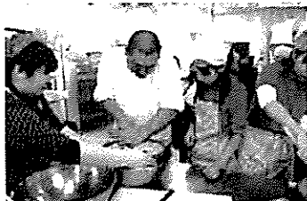
地元食材を使った 調理実習

無消毒の種の播種、除草剤に頼らない手による草取り、マルチビニールの回収など、人にも環境にもやさしい有機農業を実践しながら、安全安心な農作物を育てることを学ぶことができます。食育授業を受けたこどもたちの親（農家）が、かぼちゃの直播栽培を実践してくれるようになるなど、町内においても環境にやさしい農業が少しずつ広がってきています。また、食育授業においてこどもたちと接することで、農業の魅力をしっかり伝えられるようになったなど、受け入れ側の農家も自身の成長を実感しており、町内の様々な農家が食育に関わるようになりました。さらに、小学生以外に対しても、シェフや大学教授などのスペシャリストを招き、料理教室や有機農業の授業を行う特別授業を行い、地元農産物の良さを伝えています。