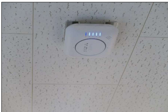
施設 Wi-Fi 設