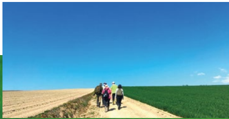
じゃがいも掘り体験(カラフルじゃがいもの宝さがし)