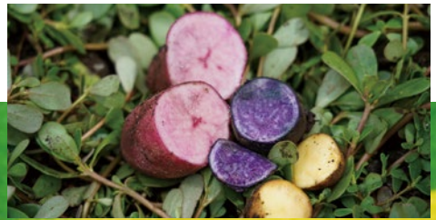
じゃがいも掘り体験(カラフルじゃがいもの宝さがし)