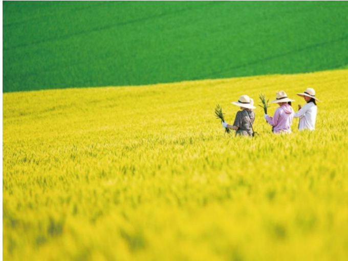
映画のワンシーンのような麦畑での麦刈り体験