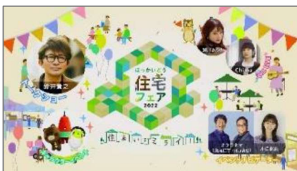
テレビCMと同一映像