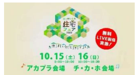
♪ほっかいどう住宅フェア2022テーマソング 「おうち」 song by Chima