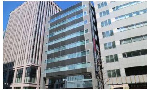
TKP札幌カンファレンスセンター7D 中央区北3条西3丁目1-6 札幌小暮ビル7階