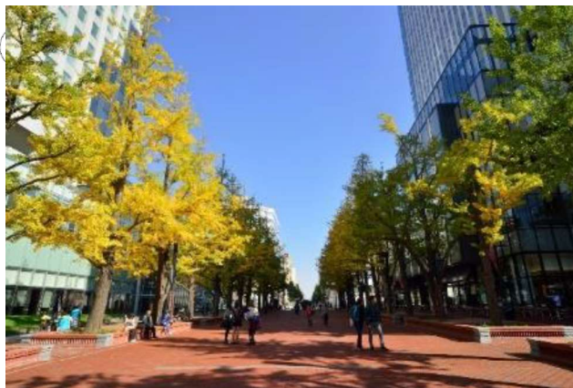
札幌市北3条広場「通称：アカプラ」全面使用（札幌市中央区北3条西3丁目）