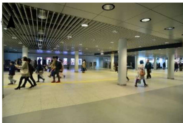
札幌駅前通地下歩行空間「通称：チカモ」憩いの空間(W)除く全館使用（札幌市中央区北3条～大通）