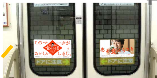
▲札幌市営地下鉄車内広告イメージ