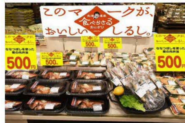
▲店頭掲載イメージ