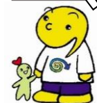
「ぐりんちゃん」 「くるりん」 北海道リサイクル イメージキャラクター