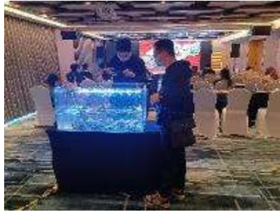
主催側ご挨拶時参加者風景