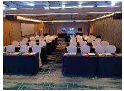
主催側ご挨拶時参加者風景