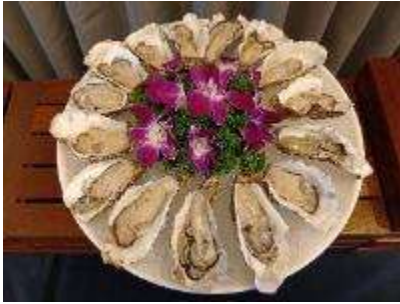
牡蠣のニンニク蒸し