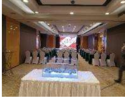
主催側ご挨拶時参加者風景