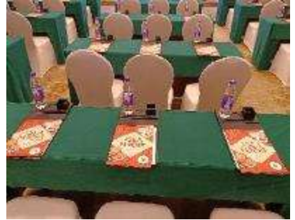
主催側ご挨拶時参加者風景