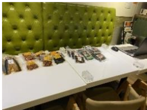
ホタテしぐれ煮、北海道にしん甘露煮、サラダ昆布