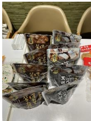
ほたてのバター醤油等