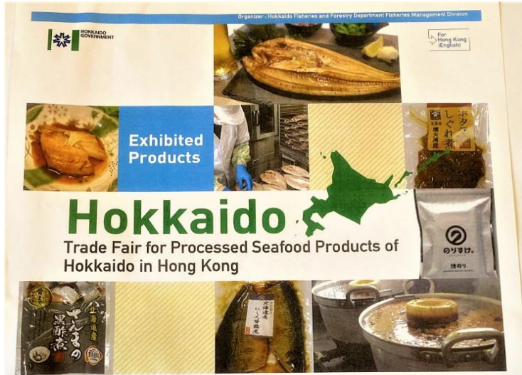
道産品輸出用シンボルマークの表示・活用