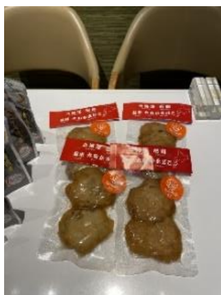
ほたて天かまぼこ