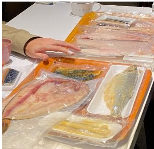
冷風熟成干し 開ホツケ特大