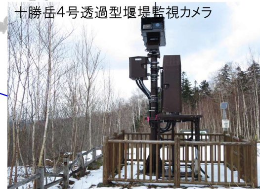
火山噴火に伴う土砂移動に備えた監視体制の強化