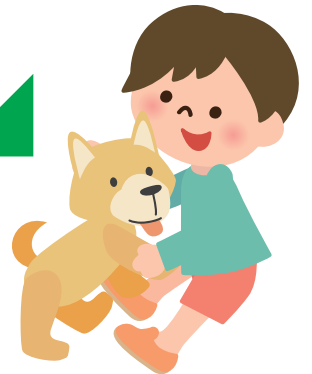
感染犬の糞が人への感染源となります。