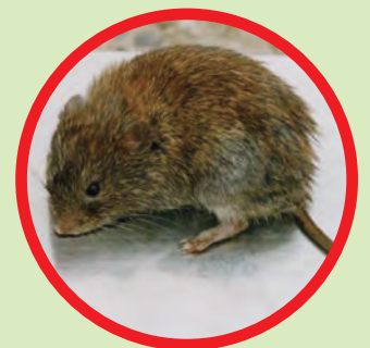
エゾヤチネズミ (体長10cm程度の小型のネズミです)