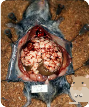
肝臓にエキノコックスが寄生した野ネズミ