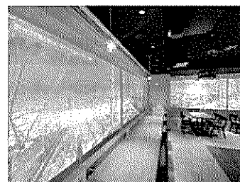
○ノースカフェ&BEER （uralaa park haneda 併設）