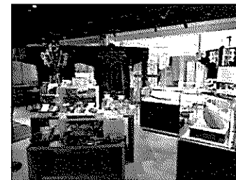
○観光パンフレット配架