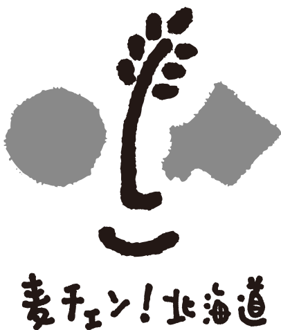
マークとショルダーフリーズの組み合わせ例(単色)

※ここに示した組み合わせ規定ロゴマークとショルダーフリーズのサイズを規定したものではありませんが、可能な限りロゴマークを主体とするサイズ関係としてください。※用途に応じてショルダーフリーズを除いた形で表示してください。※ショルダーフリーズは単色100%で使用してください。※ショルダーフリーズのフォントは「A-OTF ゴシックMB101Pro-R」です。