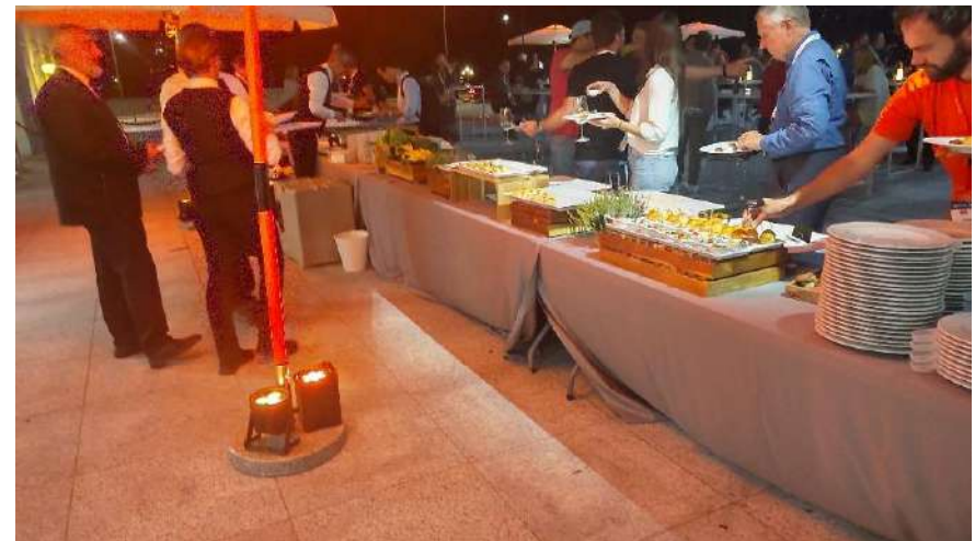
期間中、料理は全てベジタリアン対応で統一