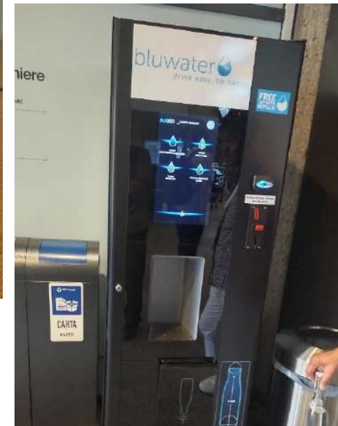
ウォーターサーバー（会場） 6