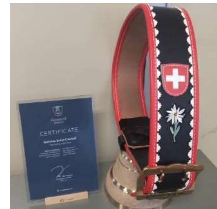
プレゼント (カウベル)