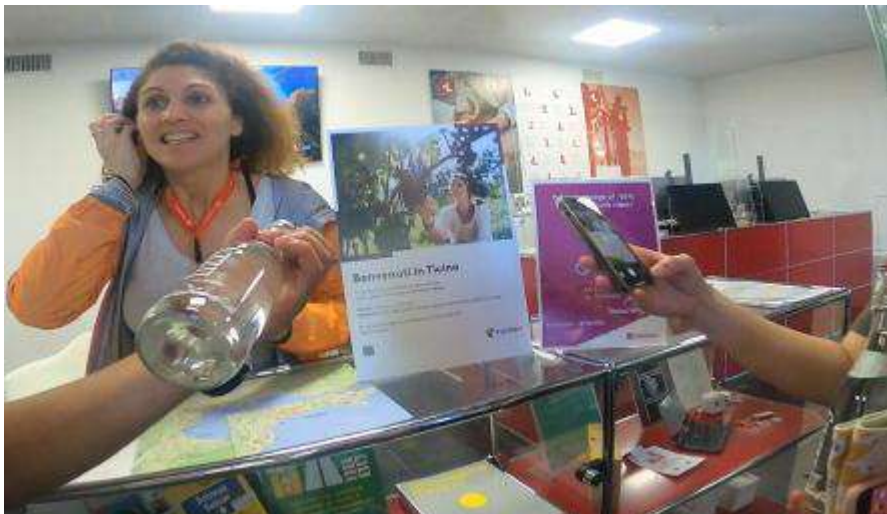
受付会場で、ボトル水と当日夜のイベント案内を受ける