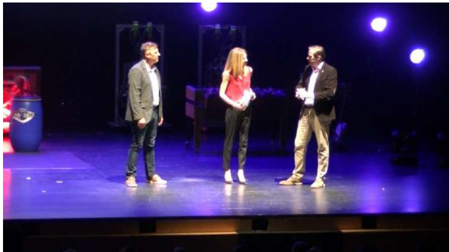
ATTAシャノン、スイス政府観光局両CEOのトーク