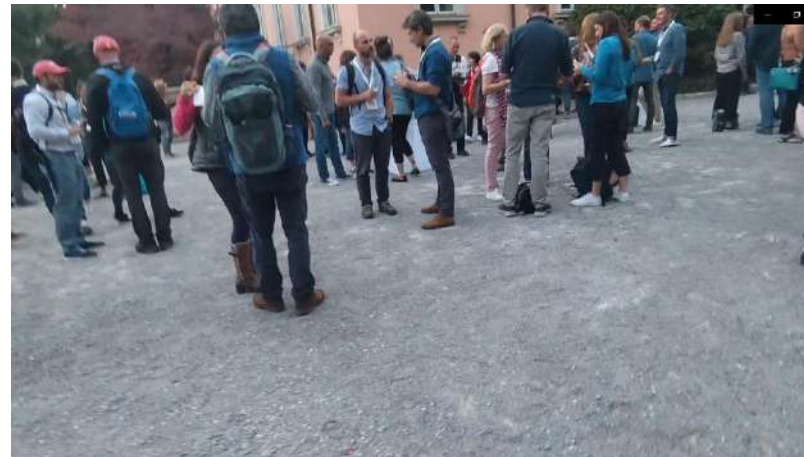
全体講演終了後、会場外でパーティ