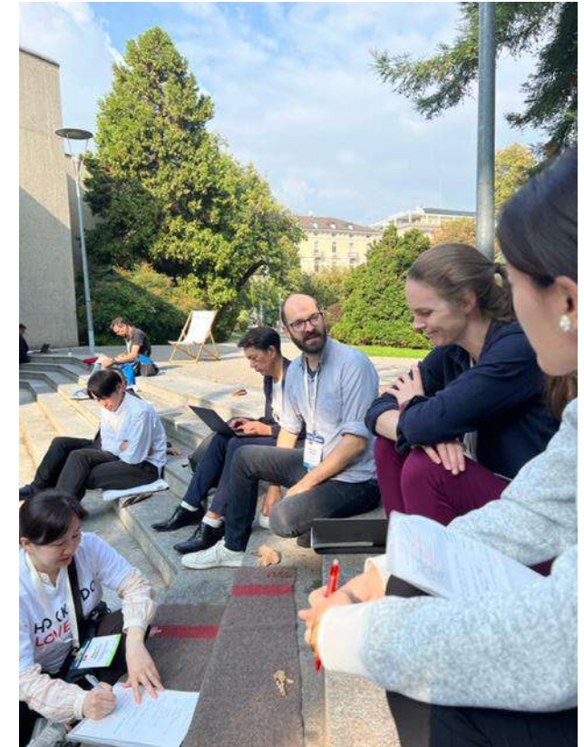
ATTA担当者、及びスイス政府観光局 等と打合せを実施。(10月5日)