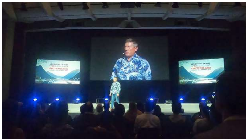
ATTA シannon CEOのスピーチ