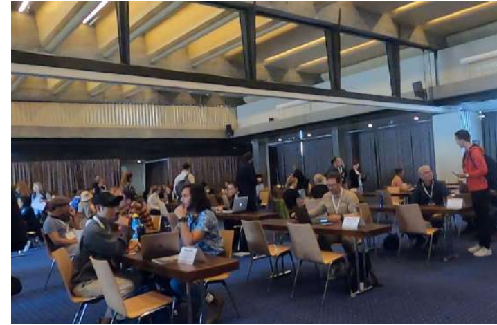
【メディアコネクト】6分間1単位で、話したいメディアのテーブルに向かう