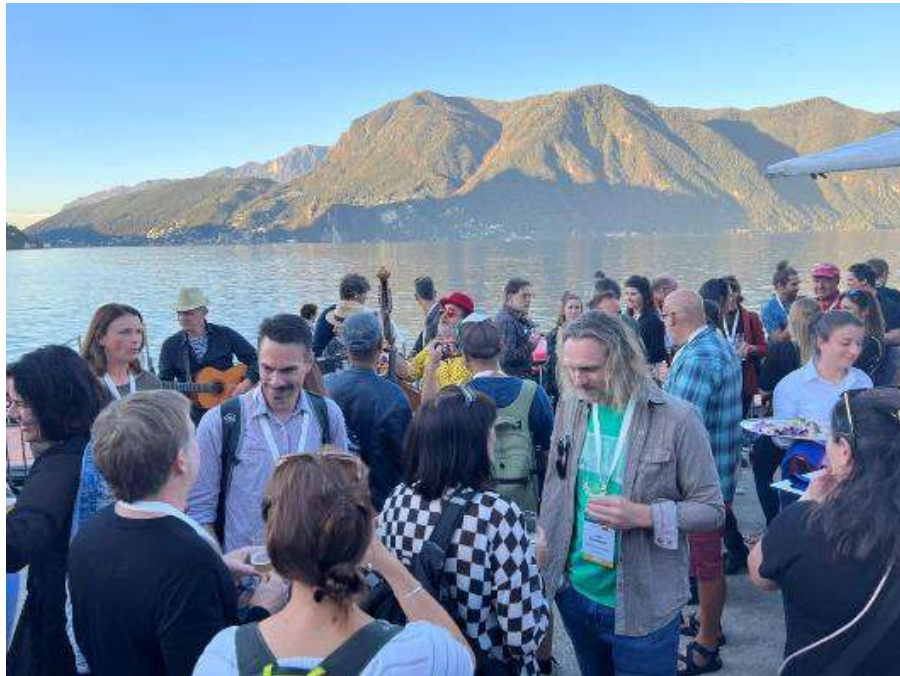
ワインパーティ 【テッチーノ州観光協会主催】 ワインは飲み放題であり、加えておつまみが提供されていた