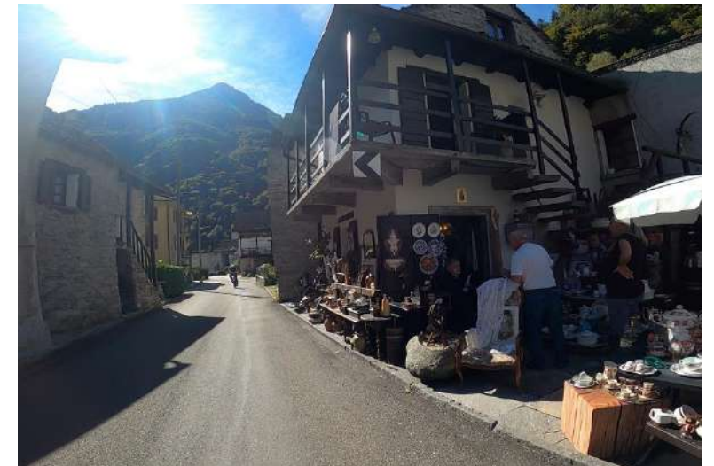
DOA催行中（復路は一般道）