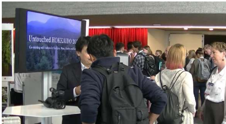
会場では実行委員会各機関から提供を受けたPR動画を放映