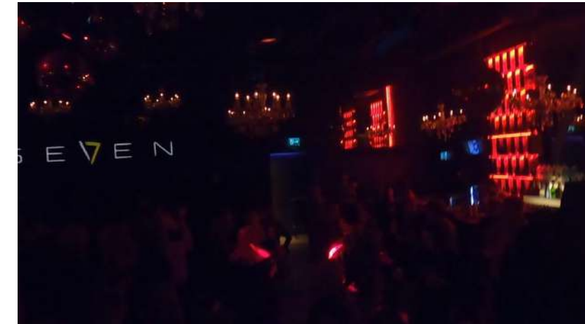
場所を移してダンスパーティが開催