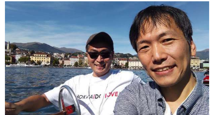
好天に恵まれ楽しんだ