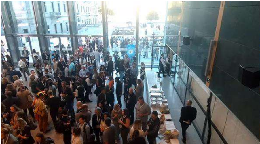
(開会前ウェルカムドリンク：その後ホールへ案内)