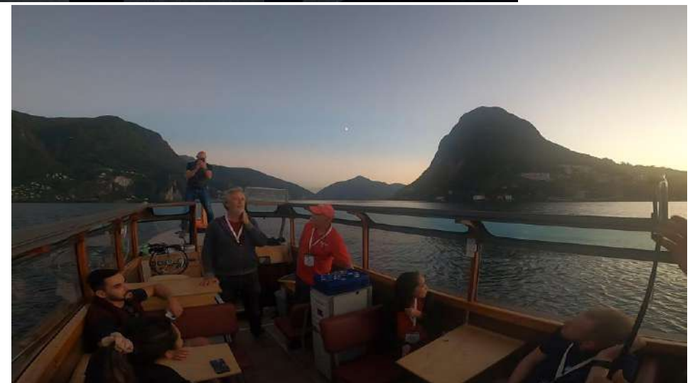
希望者はボートでルガーノ湖クルーズに参加できた