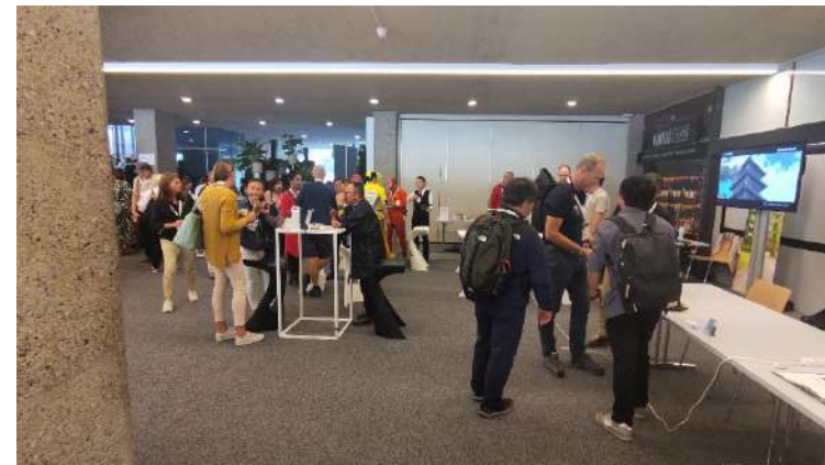
ツアーオペレーターラウンジでは、各企業参加者が交流・PR活動を実施