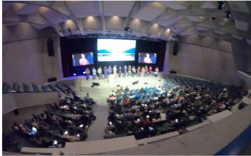
メインホール（全体講演が実施）