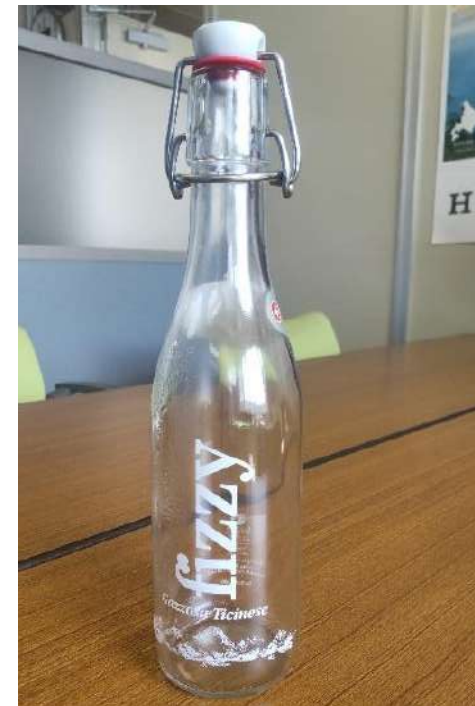
受け取ったボトル水