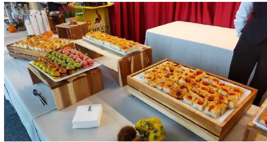
軽食時間に提供されたものの例