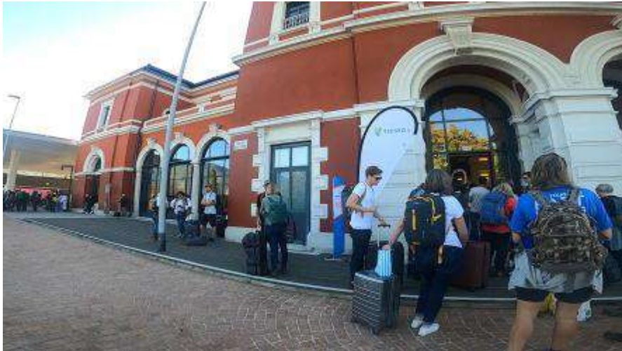
10月2日はルガーノ駅でチェックイン