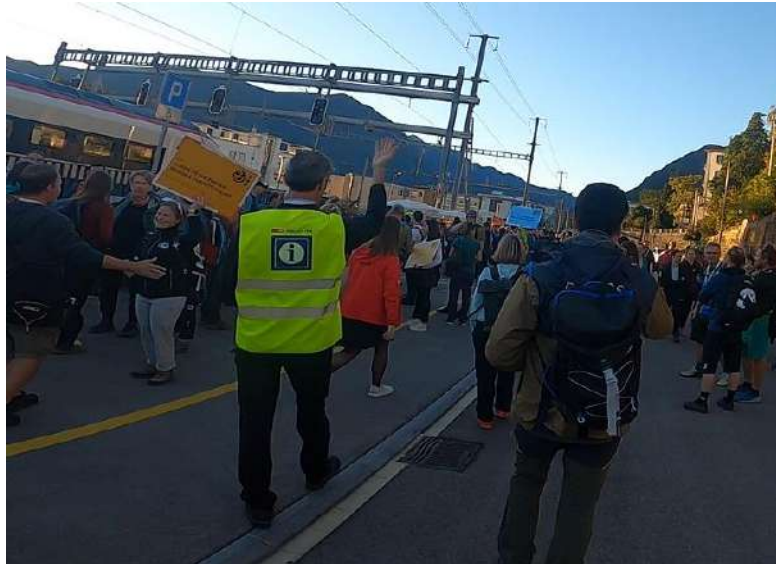
43コースの大半はルガーノ駅集合