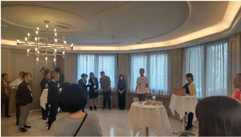
ATTAメンバーと日本人参加者との懇談会 (10月4日)