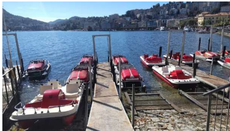
昼食後、ペダルボート乗船