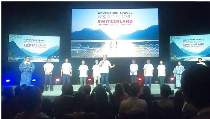
実行委員会メンバーが登壇し次年度参加を呼びかけ