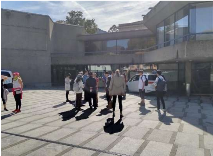
一部DOAは会場集合 (コンベンションセンター)