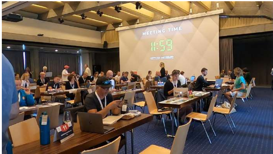
マーケットプレイス（商談会） 12分1セット