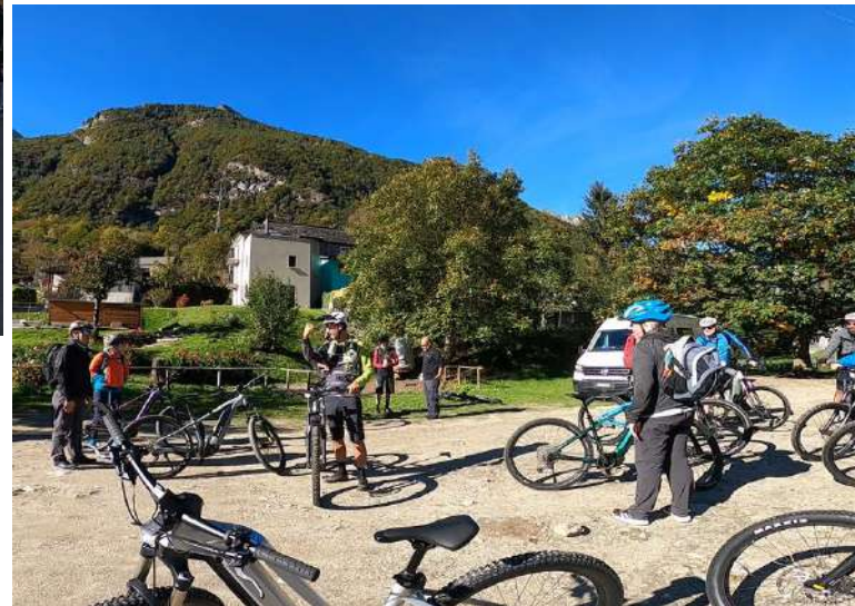
DOAインストラクション