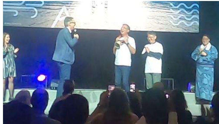
スイス政府観光局から、プレゼントの贈呈