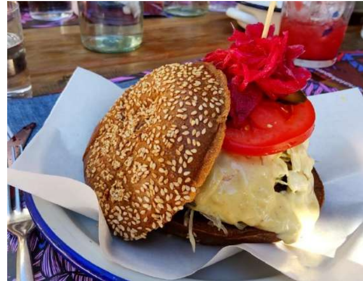
昼食はベジタリアン対応料理