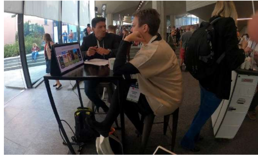
企業ミーティング用テーブル