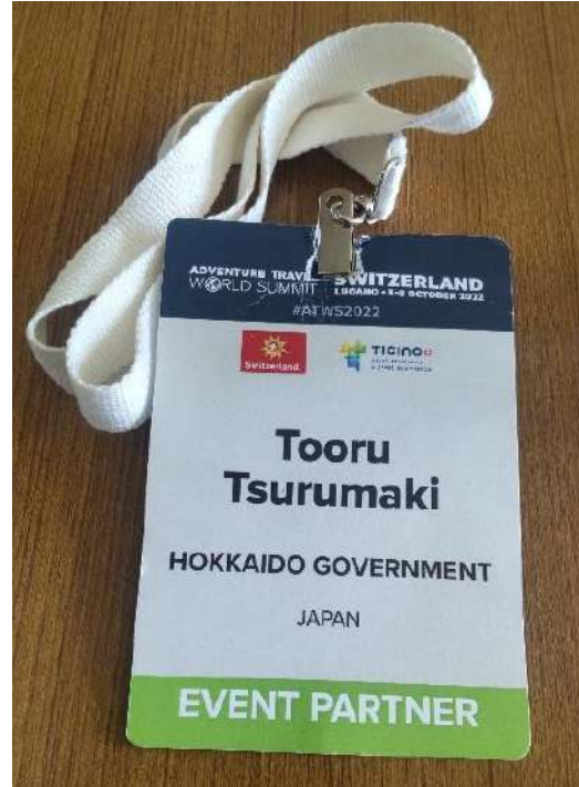
受け取ったバッジ（紙製）