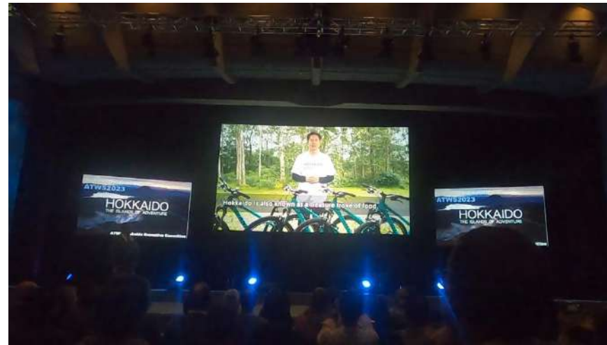
知事メッセージ動画も放映