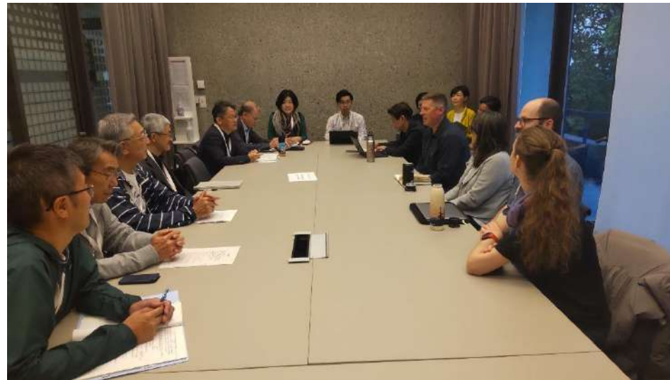
シャノンCEOほかATTA幹部とミーティングを実施。 (10月6日)