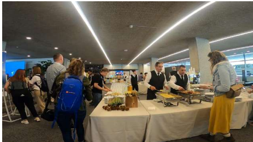
ランチ・軽食は毎日会場内4～5カ所で提供