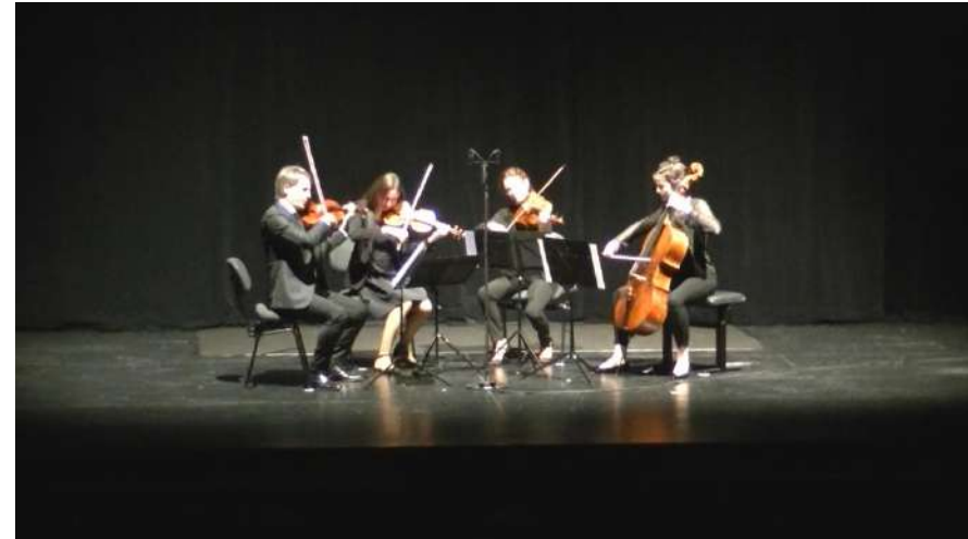
ホールに移動、MC挨拶の後、弦楽四重奏