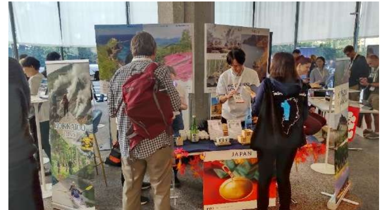
来場者に日本酒の紹介・試飲提供をしながら北海道のPRを実施