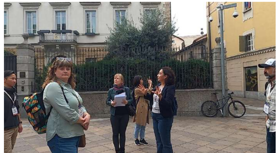
午前中は各日、シティツアーが開催（定員あり）