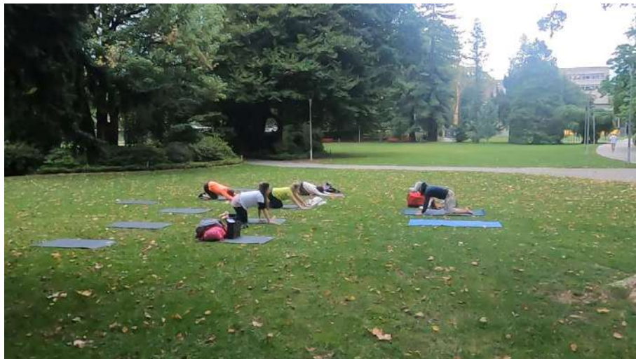
会場屋外ではヨガや、瞑想のイベントも