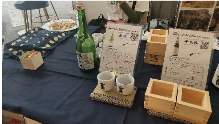
北海道酒造組合・釧路市のご協力をいただき、道内酒蔵の日本酒（一部枧）協賛を頂く