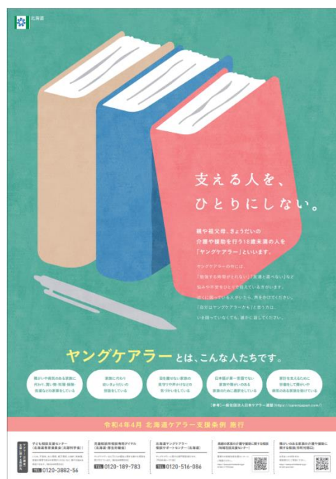
↑ (ポスター (ヤングケアラー用))