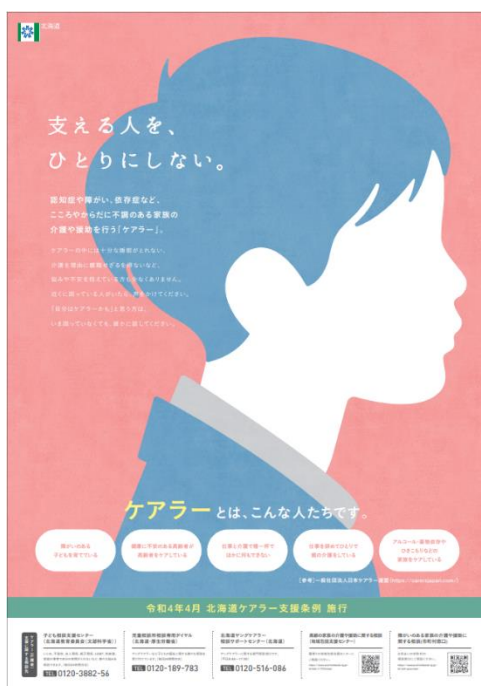
↑ (ポスター (ケアラー全般用))

この啓発資材は、掲示スペースなどを考慮して、ポスター・リーフレット・ステッカーの3種類とし、市町村や関係機関、医療機関、学校のほか、道と包括連携協定を結ぶ企業等との協働により、コンビニエンスストアなどにも広く配布しています。