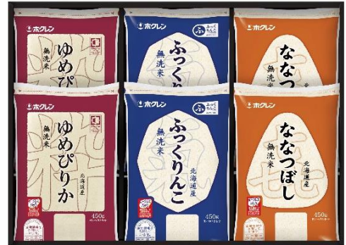
▲A 賞「プレミアム北海道米ギフトセット」

WEB 応募 URL： https://ap.morinaga.co.jp/enquete/index/amazake_hokkaidomai