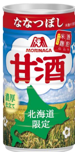
▲「甘酒 北海道限定仕込み」