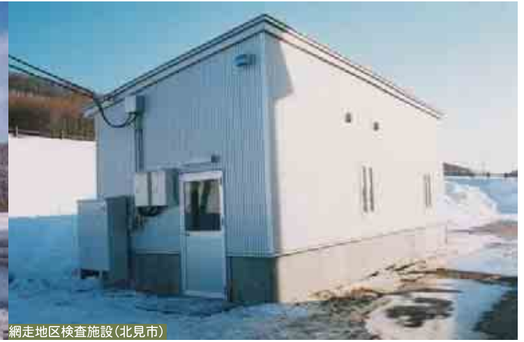
網走地区検査施設(北見市)