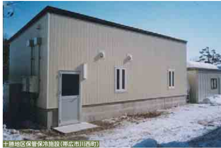
十勝地区保管保冷施設(帯広市川西町)