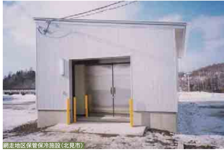
網走地区保管保冷施設(北見市)