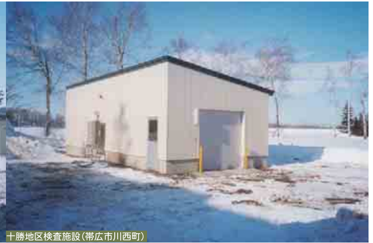
十勝地区検査施設(帯広市川西町)