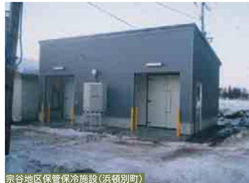
宗谷地区保管保冷施設(浜頓別町)