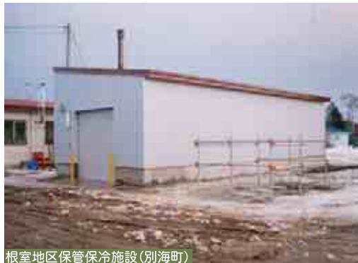
根室地区保管保冷施設(別海町)