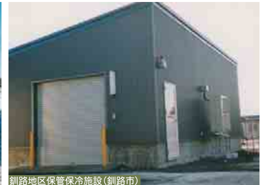
釧路地区保管保冷施設(釧路市)