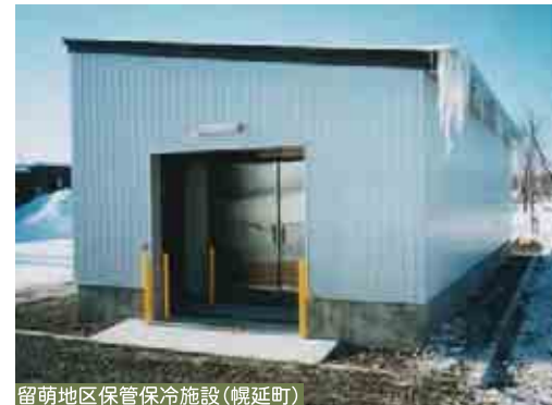
留萌地区保管保冷施設(幌延町)