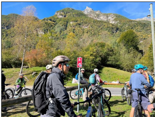
モデルツアーの様子