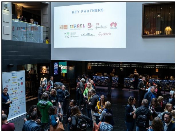
会場概況（オープングレセプション）