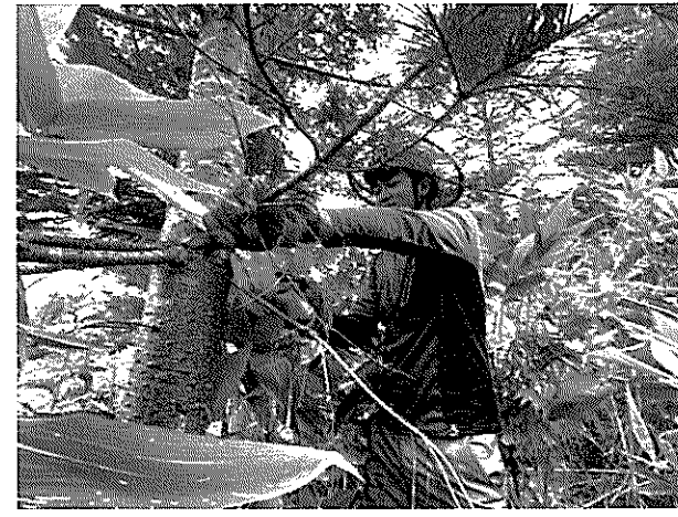
【学生の部】山の仕事師 撮影者：一ツ柳 海来さん [旭川農業高校]