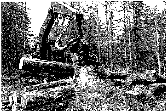
【学生の部】ハーベスタで切断中 撮影者：宝崎 壮流さん [岩見沢農業高校]