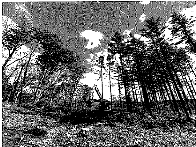
【学生の部】青空の下で

〈撮影者コメント〉 清々しい秋晴れの中、これからカラマツを伐倒するために動き出したハーベスタは迫力があり、とても印象的でした。