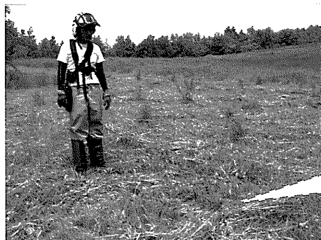
【学生の部】うさぎと僕 撮影者：榊澤 拓也さん [北の森づくり専門学院]