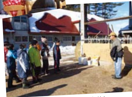
牛舎の前で目を閉じると静かなことに気付く。鳴かないのは満足している証拠