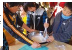
アイスクリームを作るときは、男の子たちも真剣