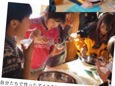
自分たちで作ったアイスクリームの味は格別