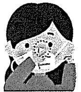
①鼻の形に合わせ すき間をふさぐ