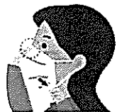
②あご下まで伸ばし顔に すき間なくフィットさせる