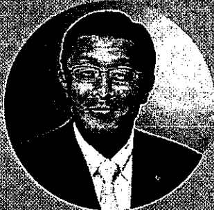
十勝ハス株式会社 代表取締役

インプット・トークセッションDAY : 道内企業のデジタル技術活用実践事例から学ぶ1日目。