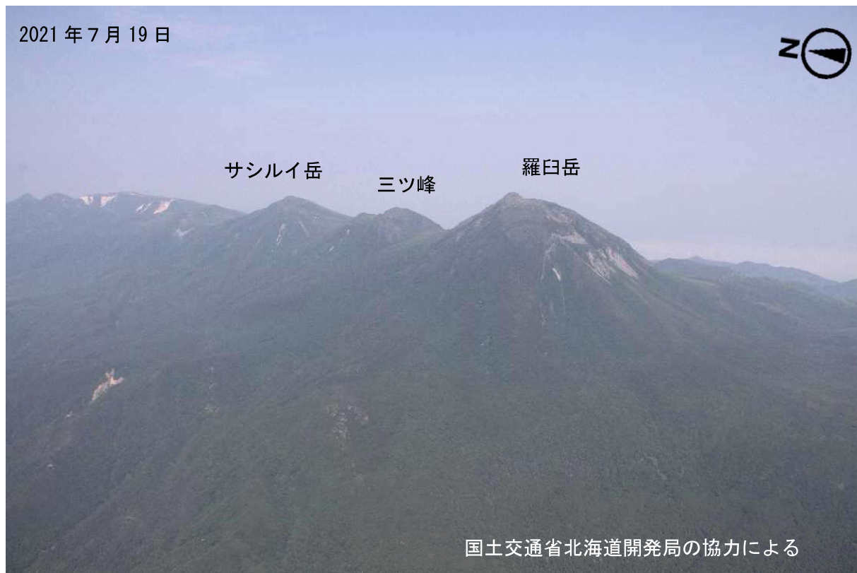
図2 羅臼岳 西側からみた羅臼岳の状況 西側上空（図1の①）から撮影