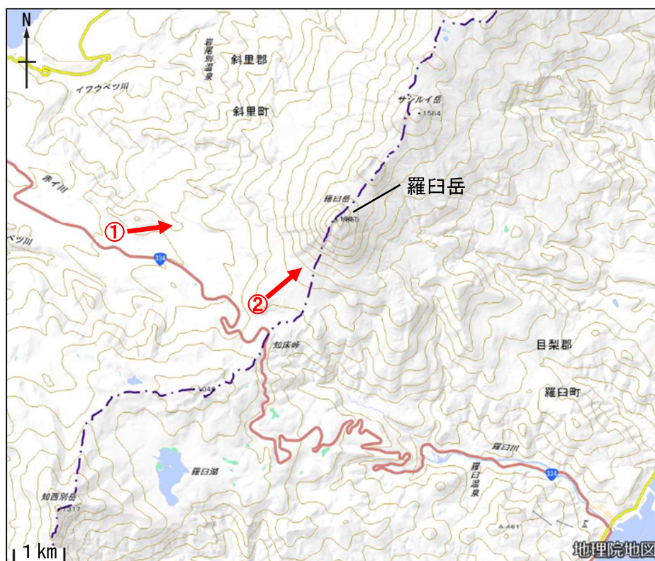
図1 羅臼岳 周辺図と赤外熱映像写真の撮影方向（矢印）

2021年7月19日に上空からの観測（国土交通省北海道開発局の協力による）を実施しました。これまでの観測と同様に噴気や地熱域は認められず、地形や植生なども前回（2019年7月）の観測と比べて特段の変化はありませんでした。