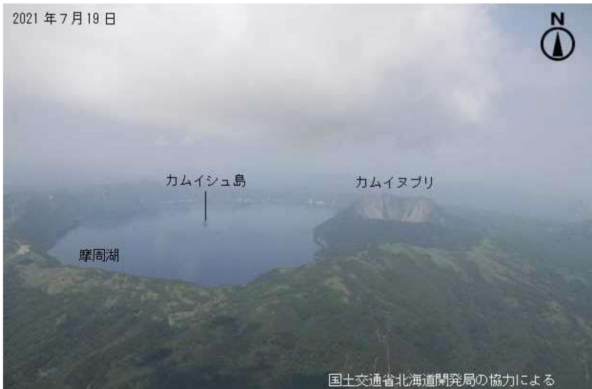
図2 摩周 摩周全体の状況 南側上空（図1の①）から撮影