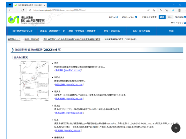
地殻変動観測の概況(2022年6月)

※SAR(Synthetic Aperture Radar 合成開口レーダー)は、人工衛星等から地表に向けて電波を照射し、戻ってきた電波を受信し、往復にかかる時間により地表までの距離を面的に観測する技術です。