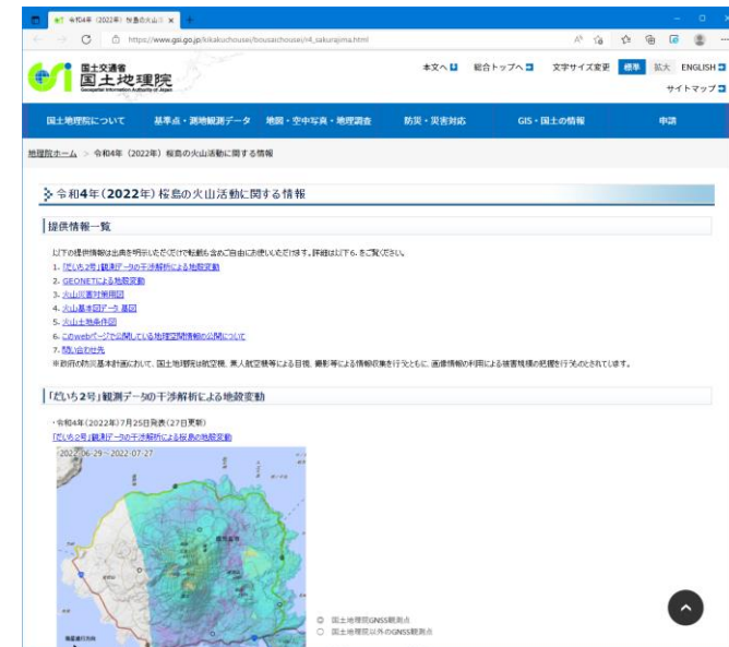
令和4年(2022年)桜島の火山活動に関する情報