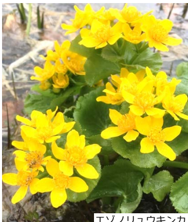
エゾノリュウキンカ

主催 | 北海道 (保健福祉部健康安全局食品衛生課食品安全グループ、衛生研究所生活科学部薬品安全グループ) 札幌市 (保健福祉局保健所)