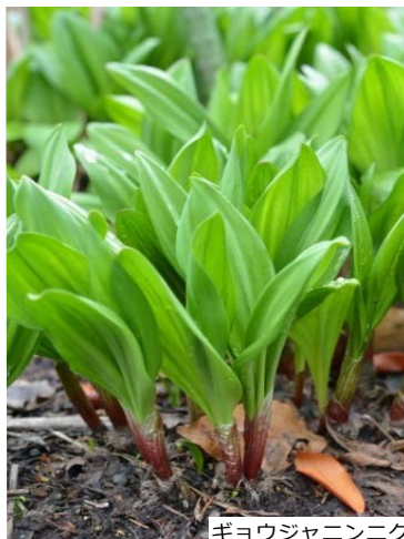
ギョウジャニンニク