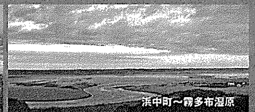
浜中町～霧多布湿原