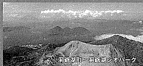
河路湖町～河路湖シオパーク