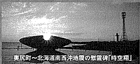
奥尻町～北海道南西沖地震の慰霊碑「時空翔」