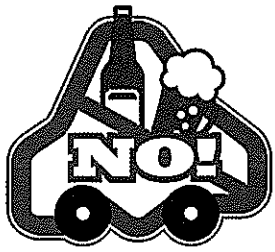
飲酒運転根絶ロゴマーク