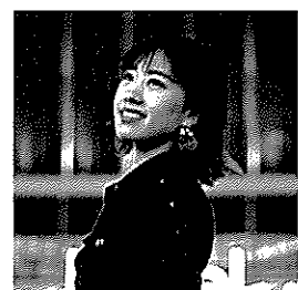
シンガーソングライター 小澤 ちひろ氏