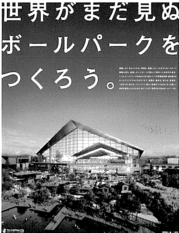
2023年開業に向け、北海道ボールパークプロジェクト建設。

建設産業で活躍する技術者などの体験談として、地元の若手社員に、建設産業で働く中での「やりがい」や「大変なこと」、「目標」などについて語っていただきます。