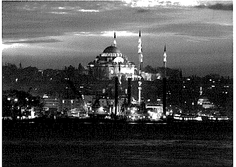
↑「歴史の街イスタンブールで、ボスボラス海峡を浚渫中！」 ボスボラス夜景浚渫船.JPG(I0-技術センター-Business-Project-Bos-TBM)

ここに、トンネル工事の粋を集めた、アジアとヨーロッパ、2つの大陸を結ぶ新たな海底トンネルが完成しました。地図に残る仕事を成し遂げた一大プロジェクトの秘話を現場に従事した技術者に語っていただきます。