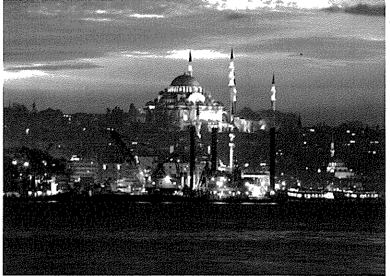
↑「歴史の街イスタンブールで、ボスポラス海峡を浚渫中！」 ボスポラス夜景浚渫船.JPG(IO-技術センター-Business-Project-Bos-TBM)

ここに、トンネル工事の粋を集めた、アジアとヨーロッパ、2つの大陸を結ぶ新たな海底トンネルが完成しました。地図に残る仕事を成し遂げた一大プロジェクトの秘話を現場に従事した技術者に語っていただきます。