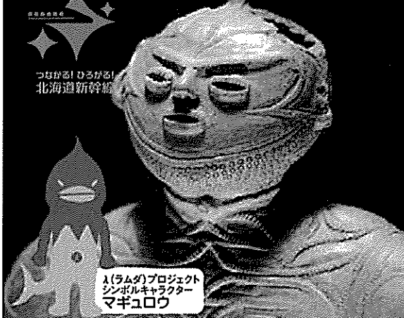
λ(ラムダ)プロジェクト シンボルキャラクター マギユロウ