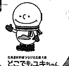
北海道新幹線つづける青森県 どこでもユキちゃん