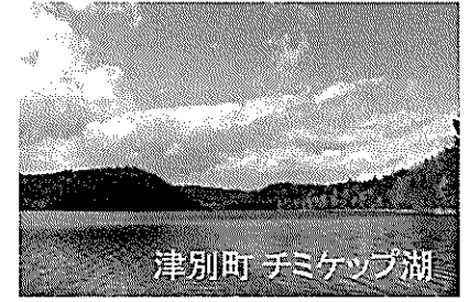
津別町 チミケップ湖