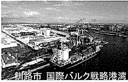
釧路市 国際バルク戦略港湾

すべての地域でワークスペースを使ってテレワークを実施いただけます。 また、ご要望に応じて、視察メニューと休暇メニューをご提案させていただきます。