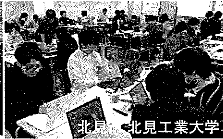
北見市 北見工業大学