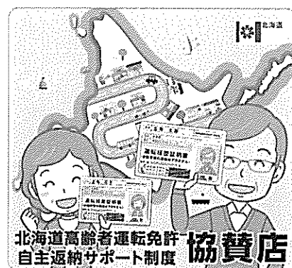
▲協賛店はこのステッカーが目印です